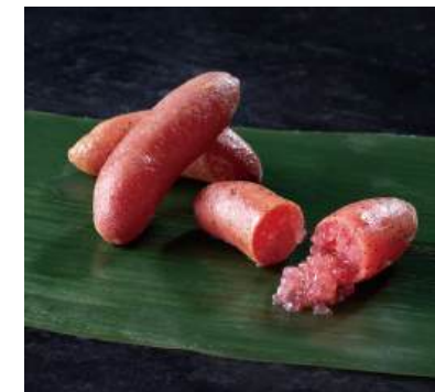
57 フィンガーライム Finger Lime 手指檸檬