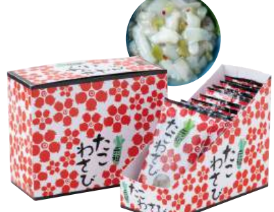
88 たこわさび(50g) Raw Octopus with Wasabi (50g) 芥末章魚

使いやすい食べきりサイズ。食卓のプラス一品にどうぞ。 ●用途/おつまみ、小鉢 ●原材料/いいだこ、山くらげ ●味付状態/わさび味 ●外装サイズ/395×185×295(mm) ●JANコード/4905256056640