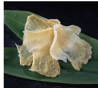
52 えいひれ Dried Stingray Fin 乾燥調味鱈魚翅

主役から脇役まで。使いやすさと品質にこだわったラインナップが、 料理の幅をさらに広げ、様々なシーンで活躍します。