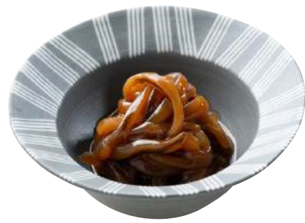
12 いか塩辛 Fermented Squid 鹽辛魷魚

いかをベースにうに、酒盗、山くらげを和えました。 ●用途/小鉢、前菜 ●原材料/いか、山くらげ、うに ●味付状態/うに味 ●外装サイズ/515×250×180(mm) 冷凍 荷姿 500g×18 ●JANコード/4905256059306