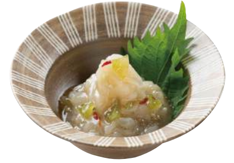
22 つんと帆立 Raw Scallop Frill with Wasabi 芥末扇貝裙邊

北海道産帆立ひもをチャンジャ風味に仕上げました。 ●用途/小鉢、トッピング等 ●原材料/ほたて貝生ヒモ、魚しょう調味料 ●味付状態/ピリ辛味 ●外装サイズ/515×250×180(mm) 冷凍 荷姿 1kg×12 ●JANコード/4905256050891