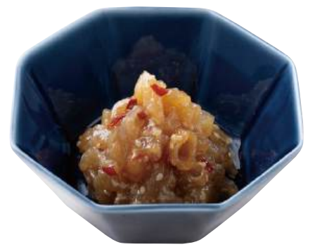
28 中華くらげ Jellyfish Salad 中華海蜇

鶏軟骨を爽やかな梅肉と和えました。 ●用途/小鉢、前菜 ●原材料/鶏軟骨、梅肉、砂糖 ●味付状態/梅味 ●外装サイズ/515×250×180(mm) 冷凍 荷姿 500g×18 ●JANコード/4905256059146