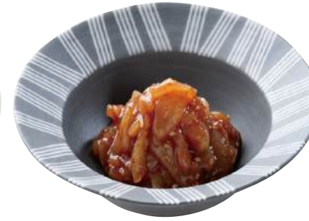
21 帆立チャンジャ Raw Scallop Frill with Korean Chili Sauce 韓式扇貝裙邊

花を咲かせたようなカニカマサラダです。 ●用途/小鉢、寿司 ●原材料/カニ風味かまぼこ、魚肉すり身 ●味付状態/マヨネーズ味 ●外装サイズ/315×250×300(mm) 冷凍 荷姿 1kg×12 ●JANコード/4905256063921