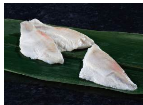
41 のどぐろ甘酢漬 Pickled Rosy Seabass in Sweet Vinegar 甘醋紅魚

スモークサーモンを花に見立てて形よく仕上げました。 ●用途/おせち、刺身盛り合わせ等 ●原材料/スモークサーモン、食塩 ●味付状態/スモーク味 ●外装サイズ/425×285×210(mm) 冷凍 荷姿 12ヶ×10 ●JANコード/4905256036437