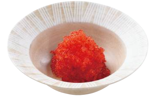
32 とびっ子レッド Seasoned Flying Fish Roe (Red) 飛魚籽(紅色)

粒がしっかりしておりツヤがありアクセント付けに最適です。 ●用途/寿司、トッピング ●原材料/とび魚卵、砂糖、食塩 ●味付状態/醤油味 ●外装サイズ/515×250×180(mm) 冷凍 荷姿 500g×18 ●JANコード/4905256059009