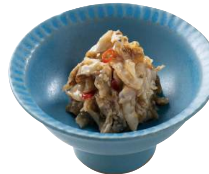
23 中華ほたて Boiled Scallop Frill with Sesame Oil 中華扇貝裙邊

鮮度の良い日本海のほたるいかを使用。 ●用途/小鉢、おつまみ ●原材料/ほたるいか、米発酵調味料 ●味付状態/醤油味 ●外装サイズ/380×340×185(mm) 冷凍 荷姿 500g×18 ●JANコード/4905256037304