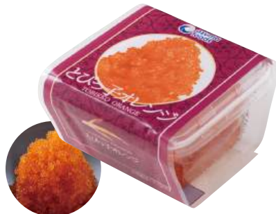
82 とびっ子オレンジ(100g) Seasoned Flying Fish Roe (Orange) (100g) 飛魚籽(橙色)

使いやすい食べきりサイズ。食卓のプラス一品にどうぞ。 ●用途/トッピング等 ●原材料/とび魚卵、砂糖、食塩 ●味付状態/醤油味 ●外装サイズ/460×280×310(mm) ●JANコード/4905256060821