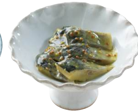
24 練マスタード Marinated Herring with Mustard 黄芥末鱈魚

良質なほたてをバランスよい味付けに和えました。 ●用途/小鉢、前菜 ●原材料/ほたて貝ひも、ごま油、砂糖 ●味付状態/中華味 ●外装サイズ/315×250×300(mm) 冷凍 荷姿 1kg×12 ●JANコード/4905256052574