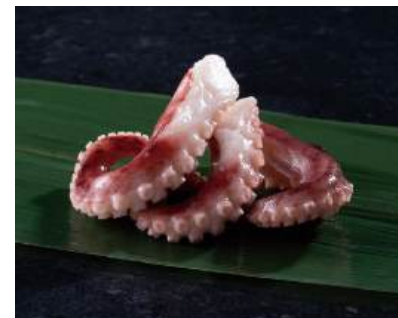
06 蛸旨煮 Simmered Octopus Legs with Soup Stock 日式煮章鱼