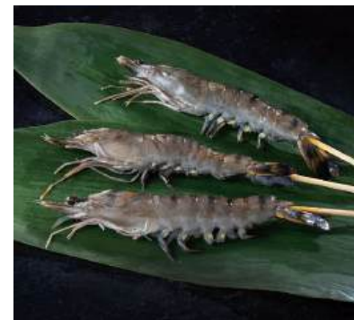
55 冷凍ソフトシェルブラックタイガー海老串 Skewered Soft-shell Black Tiger Shrimp 泰國黑虎蝦(帶竹籤)