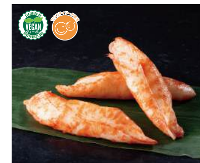
79 まるでかにかま(業務用) Plant-based Imitation Crab (Bulk) 植物蟹味棒(業務用)