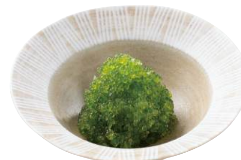
36 とびっ子わさび Seasoned Flying Fish Roe (Wasabi) 飛魚籽(芥末)

粒がしっかりしておりツヤがありアクセント付けに最適です。 ●用途/寿司、トッピング ●原材料/とび魚卵、砂糖、食塩 ●味付状態/わさび味 ●外装サイズ/515×330×180(mm) 冷凍 荷姿 300g×24 ●JANコード/4905256061873