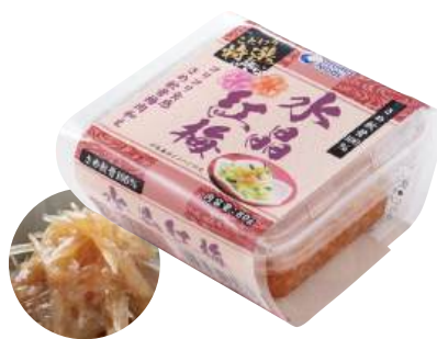
85 水晶紅梅(80g) Shark Cartilage with Pickled Plum (80g) 水晶紅梅

使いやすい食べきりサイズ。食卓のプラス一品にどうぞ。 ●用途/おつまみ、小鉢 ●原材料/軟軟骨、梅肉、砂糖 ●味付状態/梅味 ●外装サイズ/370×290×275(mm) ●JANコード/4905256060876