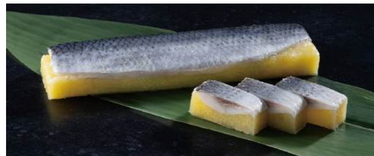
29 お寿司屋にしん Seasoned Herring with Fish Roe 寿司鱈魚

粒がしっかりしておりツヤがありアクセント付けに最適です。 ●用途/寿司、トッピング ●原材料/とび魚卵、砂糖、食塩 ●味付状態/柚子味 ●外装サイズ/515×255×180(mm) 冷凍 荷姿 300g×24 ●JANコード/4905256061880