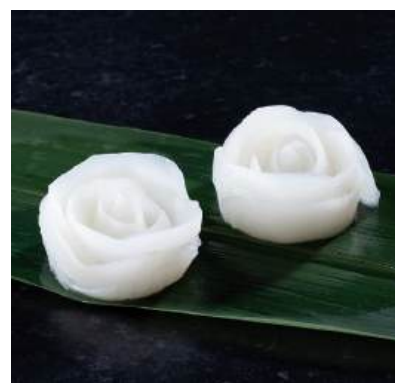
38 フレッシュローズ白(受注生産品) Dressed Cuttlefish Rose (Order-Based) 魷魚花

ひと手間かけて作った、少し特別なシーンを演出する商品を取り揃えています。 お造りから、おせちまで幅広い場面でご使用いただけます。