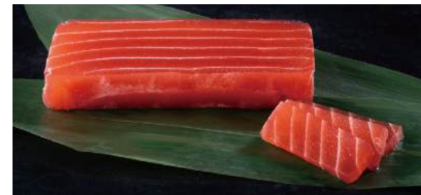
74 まるでマグロ Plant-based Tuna 植物金枪鱼

日本マタニティフード協会 https://maternity-food.org/