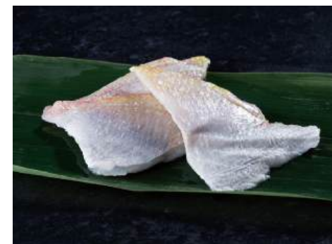
42 小鯛甘酢漬(20枚トレー) Pickled Threadfin Porgy in Sweet Vinegar 醋腌小鯛魚

山口県近海で漁獲されたのどぐろを丁寧に処理し甘酢に漬けました。 ●用途/寿司、酢の物等 ●原材料/アカムツ、醸造酢、砂糖 ●味付状態/甘酢味 ●外装サイズ/450×310×195(mm) 冷凍 荷姿 30枚×24 ●JANコード/4905256054455