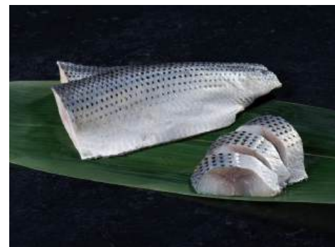
43 この酢 Pickled Gizzard Shad 醋浸斑鯨魚

山口県近海で漁獲された小鯛を丁寧に処理し甘酢に漬けました。 ●用途/寿司、酢の物等 ●原材料/レンコダイ、醸造酢、砂糖 ●味付状態/甘酢味 ●外装サイズ/460×310×190(mm) 冷凍 荷姿 20枚×20 ●JANコード/4905256053953