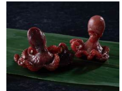
08 醤油いいだこ Baby Octopus with Soy Sauce 醤油小章鱼