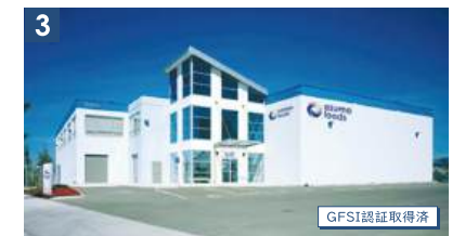
Azuma Foods (Canada) Co., Ltd.

設立:1990年/出来事:東西ドイツ統一 トレンド:バブル期・ブランドとボディコン