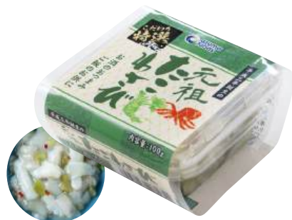
81 たこわさび(100g) Raw Octopus with Wasabi (100g) 芥末章魚

使いやすい食べきりサイズ。食卓のプラス一品にどうぞ。 ●用途/おつまみ、小鉢 ●原材料/いいだこ、山くらげ、茎わさび ●味付状態/わさび味 ●外装サイズ/375×290×275(mm) ●JANコード/4905256060722