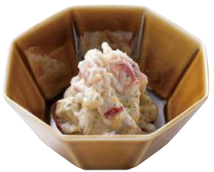
18 カナダ北寄貝サラダ Surf Clam Salad with Mayo 加拿大北極貝沙拉

アカニシ貝の噛み応えとワサビがよく合います。 ●用途/小鉢、前菜 ●原材料/アカニシ貝、山くらげ、切干大根 ●味付状態/わさび味 ●外装サイズ/515×250×180(mm) 冷凍 荷姿 500g×18 ●JANコード/4905256048973