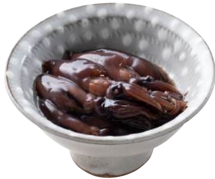
16 ほたるいか沖漬 Fermented Firefly Squid with Soy Sauce 日式螢烏賊沖漬

いかと数の子を和えた定番商品です。 ●用途/小鉢、おつまみ ●原材料/いか、数の子 ●味付状態/薄味 ●外装サイズ/515×250×180(mm) 冷凍 荷姿 1kg×12 ●JANコード/49052560504066