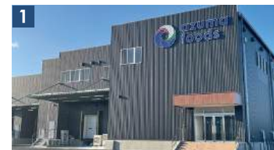
Azuma Foods Co., Ltd.