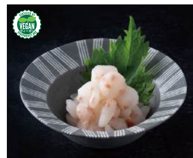
78 まるでサラダシュリンプ Plant-based Salad Shrimp 植物沙拉蝦仁