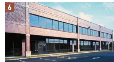
Azuma Foods International Inc., U.S.A. New York Branch

設立:2019年/出来事:消費税10%へ引き上げ トレンド:令和×韓国ファッションの爆発的人気