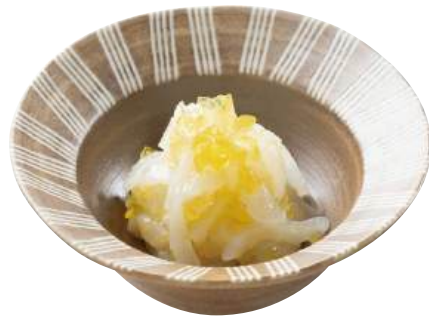
13 いか柚子ジュレ和え Cuttlefish with Citrus Gelee 柚香魷魚

昔ながらの製法でいかわたを加えた濃厚な味付けです。 ●用途/小鉢、おつまみ ●原材料/いか、還元水あめ、いかわた ●味付状態/塩辛味 ●外装サイズ/465×355×150(mm) 冷凍 荷姿 500g×24 ●JANコード/4905256064126