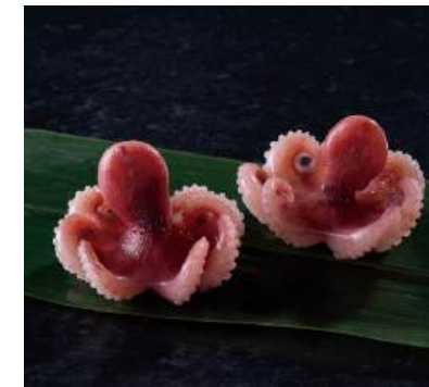
54 ボイルいいだこIQF(M) Boiled Baby Octopus (IQF, M size) 煮熟小章魚IQF(M)