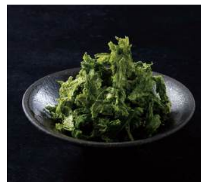
58 あおさのり Dried Aosa Seaweed 青海苔