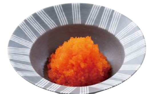
37 《MSC》まさごオレンジプレミアム Seasoned Capelin Roe (Orange) 橙色多春魚籽

粒がしっかりしておりツヤがありアクセント付けに最適です。 ●用途/寿司、トッピング ●原材料/とび魚卵、砂糖、食塩 ●味付状態/わさび味 ●外装サイズ/515×330×180(mm) 冷凍 荷姿 300g×24 ●JANコード/4905256061873