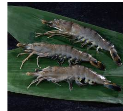
56 ソフトシェルシュリンプ(20尾) Soft-shell Black Tiger Shrimp 20pcs 泰國黑虎蝦