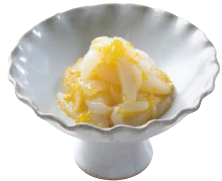
15 コリコリいか黄金 Cuttlefish with Fish Roe 黄金花枝

梅の酸味が爽やか、見た目も可愛い商品です。 ●用途/小鉢、前菜 ●原材料/いか、梅、数の子 ●味付状態/梅風味 ●外装サイズ/515×250×180(mm) 冷凍 荷姿 800g×12 ●JANコード/4905256060364