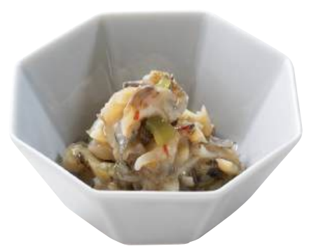
17 磯螺わさび Boiled Top Shell with Wasabi 芥末海螺

茎わかめに糸寒天、唐辛子、ごまをプラスしたごまベースのさっぱり味。 ●用途/小鉢、前菜 ●原材料/茎わかめ、しょう油、果糖ブドウ糖液糖 ●味付状態/ゴマ風味 ●外装サイズ/470×270×180(mm) 冷凍 荷姿 1kg×12 ●JANコード/4905256057173