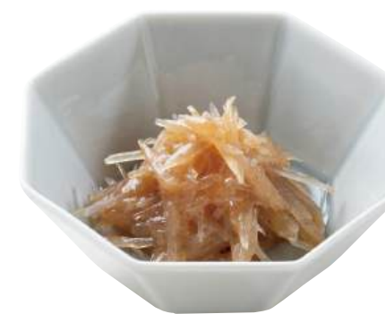
26 水晶紅梅 Shark Cartilage with Salted Plum 水晶紅梅

魚介類をふんだんに使用した和え物です。 ●用途/小鉢、寿司 ●原材料/カナダ北寄貝、半固体状ドレッシング ●味付状態/マヨネーズ味 ●外装サイズ/515×255×180(mm) 冷凍 荷姿 1kg×12 ●JANコード/4905256064003