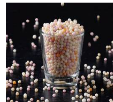
60 ぶぶあられ(各種) Japanese Rice Cracker 日式米菓