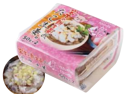
87 たこ生姜(50g×2段) Raw Octopus with Ginger (50g×2) 生姜章魚

使いやすい食べきりサイズ。食卓のプラス一品にどうぞ。 ●用途/おつまみ、小鉢 ●原材料/いいだこ、砂糖混合ぶどう糖果糖液糖 ●味付状態/生姜味 ●外装サイズ/380×280×310(mm) ●JANコード/4905256061804