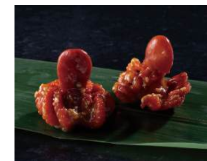
10 中華いいだこ Baby Octopus with Sesame Oil 中華小章鱼