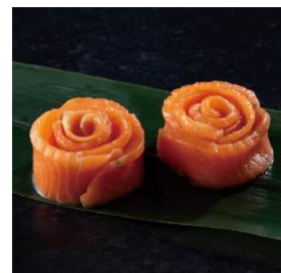
39 トラウトローズ(受注生産品) Dressed Salmon Trout Rose (Order-Based) 鮭魚花

歯ごたえのあるイカを花に見立てて丁寧に仕上げました。 ●用途/おせち、刺身盛り合わせ等 ●原材料/いか、食塩、砂糖 ●味付状態/素材 ●外装サイズ/425×285×210(mm) 冷凍 荷姿 12ヶ×10 ●JANコード/4905256036536