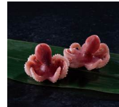
53 ボイルいいだこIQF(S) Boiled Baby Octopus (IQF, S size) 煮熟小章魚IQF(S)