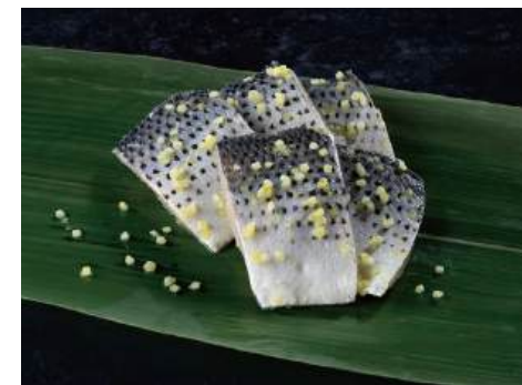
44 このしろ粟漬 Pickled Gizzard Shad with Millet 斑鯨魚粟漬

このしろを特製の酢に漬け込みました。 ●用途/寿司、酢の物等 ●原材料/このしろ、醸造酢 ●味付状態/酢味 ●外装サイズ/490×370×285(mm) 冷凍 荷姿 1kg×10 ●JANコード/4905256061460