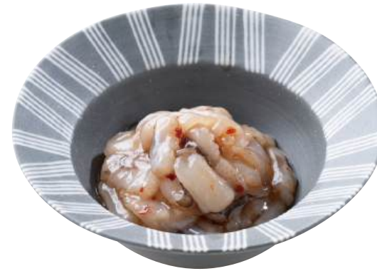
04 たこ生造り Raw Octopus with Salt 鹽漬生章鱼

こだわりの厳選した素材を、幅広い味わいでご用意しました。 素材の形を活かしたものから、 たこわさびの姉妹品まで視覚でも楽しめるバリエーションを取り揃えています。