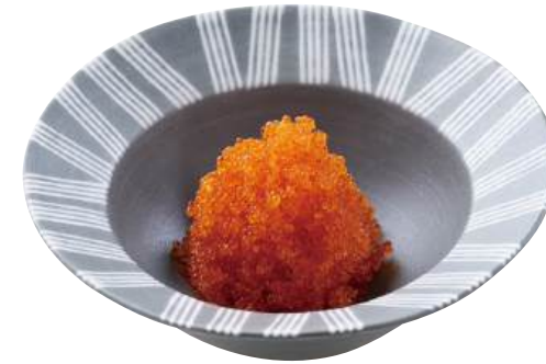
31 とびっ子オレンジ Seasoned Flying Fish Roe (Orange) 飛魚籽(橙色)

はじける食感が特徴の「とびっ子」や、 原料にこだわり抜いた「まさご」は寿司ネタなど料理の主役としてはもちろん、 多様なメニューのトッピングに最適な色・味をご用意しています。