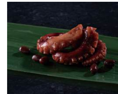
07 たこ小倉煮 Simmered Octopus Legs with Sweet Red Beans 紅豆章鱼