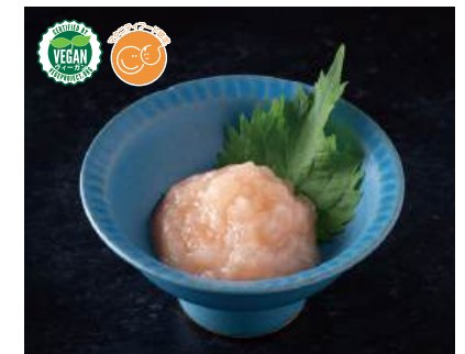
77 まるでネギトロ Plant-based Minced Tuna 植物葱花鮭魚泥