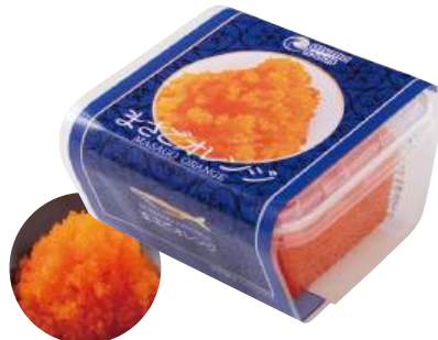
83 まさごオレンジ(100g) Seasoned Capelin Roe (Orange) (100g) 多春魚籽(橙色)

使いやすい食べきりサイズ。食卓のプラス一品にどうぞ。 ●用途/トッピング等 ●原材料/カラフトシヤモ卵、数の子 ●味付状態/醤油味 ●外装サイズ/460×280×310(mm) ●JANコード/4905256060814