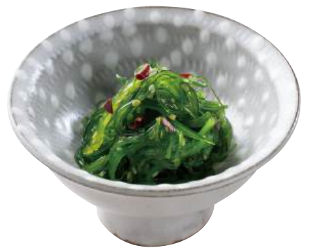
25 ごまわかめ Seaweed Salad 中華海帶絲

鱈の油脂分に酸味がピリッとよく合います。 ●用途/小鉢、前菜 ●原材料/にしん、マスタード ●味付状態/マスタード風味 ●外装サイズ/315×250×300(mm) 冷凍 荷姿 1kg×12 ●JANコード/4905256057333