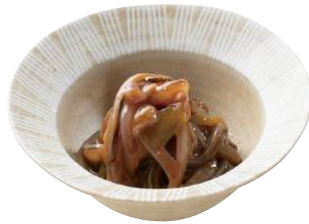
11 いかうに酒盗 Squid and Sea Urchin with Bonito Liver 海膽酒盗漬魚

和洋中、手軽にそのままお楽しみいただける商品をご用意しています。 味付けだけでなく、見た目や食感でのアクセントを加えることができます。