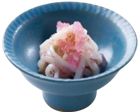
14 コリコリいか梅ジュレ和え Cuttlefish with Plum Gelee 梅香爽脆魷魚

国産帆立ヒモを使用しわさび味に仕上げました。 ●用途/小鉢、前菜 ●原材料/ほたて貝ひも、山くらげ ●味付状態/わさび味 ●外装サイズ/515×250×180(mm) 冷凍 荷姿 1kg×12 ●JANコード/4905256051003