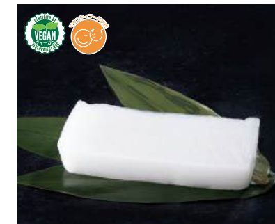
76 まるでイカ Plant-based Squid 植物魷魚