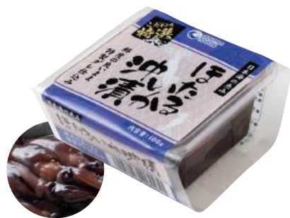
84 ほたるいか沖漬(100g) Fermented Firefly Squid with Soy Sauce (100g) 日式螢烏賊沖漬

使いやすい食べきりサイズ。食卓のプラス一品にどうぞ。 ●用途/おつまみ、小鉢 ●原材料/ほたるいか、しょう油 ●味付状態/醤油味 ●外装サイズ/370×290×275(mm) ●JANコード/4905256060951