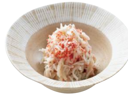
20 花咲サラダ Imitation Crab Meat with Mayo 花咲蟹味沙拉

いかと数の子を和えたロングセラー商品です。 ●用途/小鉢、前菜 ●原材料/いか、白だし醤油、カラフトシヤモ卵 ●味付状態/柚子風味 ●外装サイズ/515×255×180(mm) 冷凍 荷姿 800g×12 ●JANコード/4905256061491