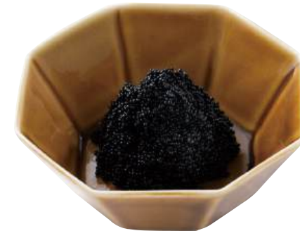
34 とびっ子ブラック Seasoned Flying Fish Roe (Black) 飛魚籽(黒色)

粒がしっかりしておりツヤがありアクセント付けに最適です。 ●用途/寿司、トッピング ●原材料/とび魚卵、砂糖、食塩 ●味付状態/醤油味 ●外装サイズ/515×250×180(mm) 冷凍 荷姿 500g×18 ●JANコード/4905256059177