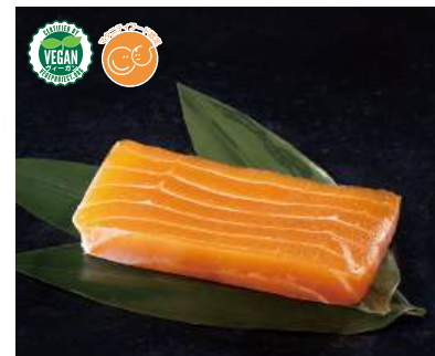
75 まるでサーモン Plant-based Salmon 植物三文魚