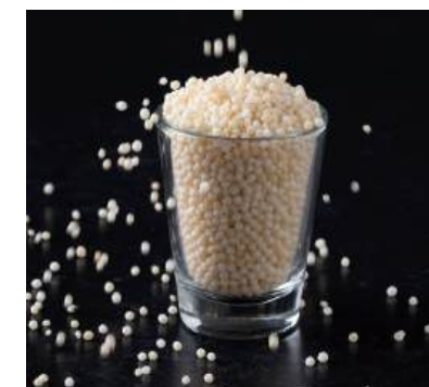
59 真砂あられ Japanese Tiny Rice Cracker 珍珠米菓