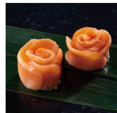
40 スモークトラウトローズ(受注生産品) Dressed Smoke Salmon Trout Rose (Order-Based) 熏製鮭魚花

サーモントラウトを花に見立てて形よく仕上げました。 ●用途/おせち、刺身盛り合わせ等 ●原材料/サーモントラウト ●味付状態/素材 ●外装サイズ/425×285×210(mm) 冷凍 荷姿 12ヶ×10