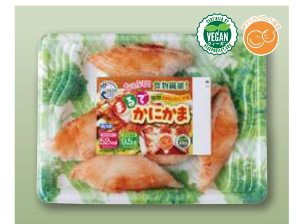
80 まるでかにかま Plant-based Imitation Crab (Retail) 植物蟹味棒