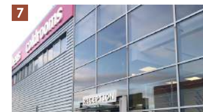
Azuma Foods UK Ltd.

設立:2003年/出来事:六本木ヒルズ開業 トレンド:Y2K・ヘソ出し・ギャル文化