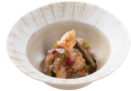
05 生たこキムチ Raw Octopus with Kim Chee Sauce 韓式章鱼