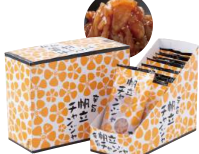
89 帆立チャンジャ(50g) Spicy Raw Scallop Frill (50g) 韓式扇貝裙邊

使いやすい食べきりサイズ。食卓のプラス一品にどうぞ。 ●用途/おつまみ、小鉢 ●原材料/はたて貝生ヒモ、魚しょう調味料 ●味付状態/ピリ辛味 ●外装サイズ/395×185×295(mm) ●JANコード/4905256056688