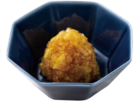
35 とびっ子柚子 Seasoned Flying Fish Roe (Yuzu) 飛魚籽(柚子)

粒がしっかりしておりツヤがありアクセント付けに最適です。 ●用途/寿司、トッピング ●原材料/とび魚卵、砂糖、食塩 ●味付状態/醤油味 ●外装サイズ/515×250×180(mm) 冷凍 荷姿 300g×24 ●JANコード/4905256061897