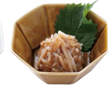
27 やげん紅梅 Chicken Cartilage with Salted Plum 紅梅雞脆骨

軟骨を爽やかな梅肉と和えました。 ●用途/小鉢、前菜 ●原材料/軟骨、梅肉、砂糖 ●味付状態/梅味 ●外装サイズ/515×250×180(mm) 冷凍 荷姿 300g×24 ●JANコード/4905256057319