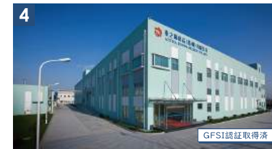
Azuma Foods (Suzhou) Co., Ltd.

設立:2003年/出来事:六本木ヒルズ開業 トレンド:Y2K・ヘソ出し・ギャル文化