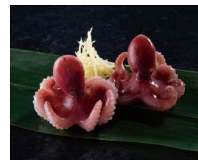
09 いいだこ酢漬 Marinated Baby Octopus with Ginger 甘醋漬小章鱼