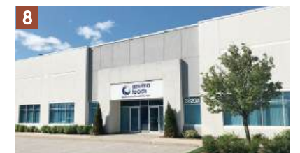
Azuma Foods (Canada) Co., Ltd. Toronto Branch

設立:2014年/出来事:消費税8%へ引き上げ トレンド:ノームコア・シンプル最強