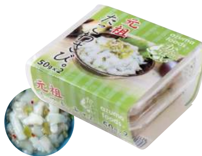
86 たこわさび(50g×2段) Raw Octopus with Wasabi (50g×2) 芥末章魚

使いやすい食べきりサイズ。食卓のプラス一品にどうぞ。 ●用途/おつまみ、小鉢 ●原材料/いいだこ、山くらげ ●味付状態/わさび味 ●外装サイズ/380×280×310(mm) ●JANコード/4905256061736