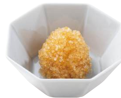
33 とびっ子ゴールド Seasoned Flying Fish Roe (Gold) 飛魚籽(金色)

粒がしっかりしておりツヤがありアクセント付けに最適です。 ●用途/寿司、トッピング ●原材料/とび魚卵、砂糖、食塩 ●味付状態/醤油味 ●外装サイズ/515×250×180(mm) 冷凍 荷姿 500g×18 ●JANコード/4905256059160