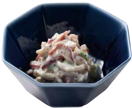
19 海鮮チーズサラダ Seafood Salad with Cheese 海鮮芝士沙拉

シーフードサラダのロングセラー商品です。 ●用途/小鉢、寿司 ●原材料/カナダ北寄貝、半固体状ドレッシング、いか ●味付状態/マヨネーズ味 ●外装サイズ/515×250×180(mm) 冷凍 荷姿 1kg×12 ●JANコード/4905256060883